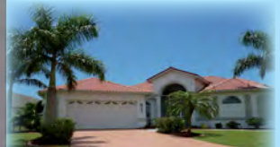
Villa Paloma, Florida