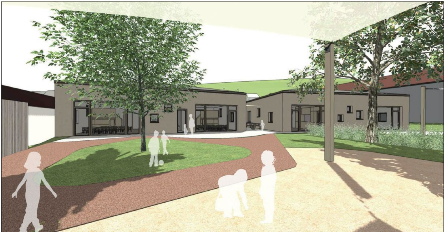
Rund 6 Millionen Euro soll die neue Kindertagesstätte in Eltmann kosten, mit deren Entwurfsplanung sich der Stadtrat in seiner Dezember-Sitzung befasste. Repro: Schmitt Vogels Architekten, Bamberg